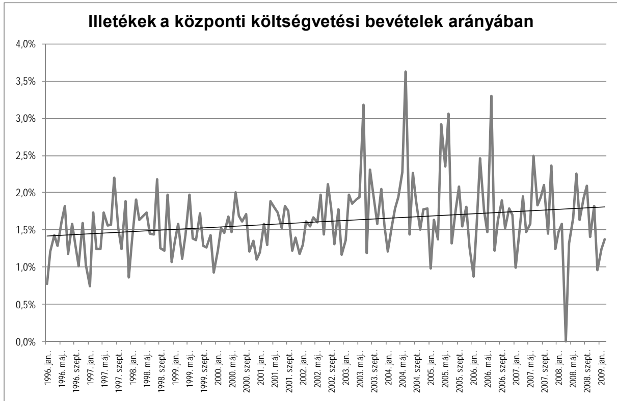
1. ábra: Illetékek a központi költségvetési bevételek arányában